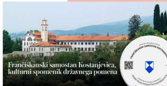
Franciškanski samostan Kostanjevica, kulturni spomenik državnega pomena

Več informacij in prijava na natečaj sta na voljo na: www.xcenter.si